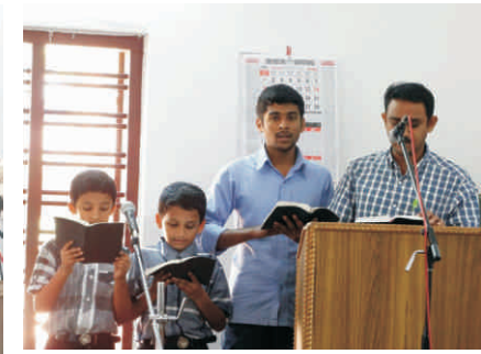
കൊയർ - ഗാനം ആലപിക്കുന്നു